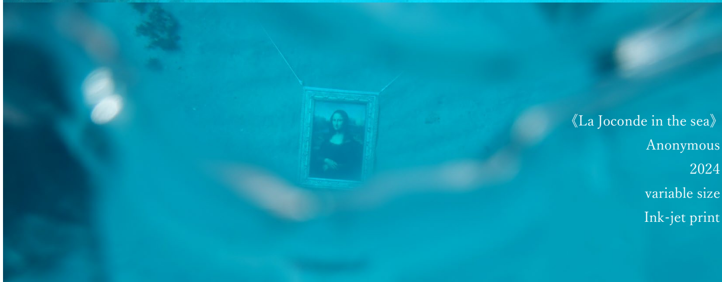
《La Joconde in the sea》